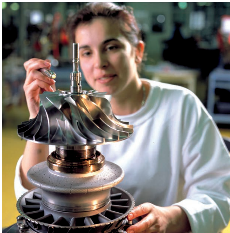
■ Turbomeca, fabricant de turbines à gaz, participe au dynamisme de Midi-Pyrénées.

PSA a réduit la voilure sur ses sites de Sausheim (Haut-Rhin), Chartres-de-Bretagne (Ille-et-Vilaine) et Trémery (Moselle), tout en préparant la fermeture définitive de son usine d'Aulnay-sous-Bois (Seine-Saint-Denis). Seul le centre technique de PSA à Vélizy-Villacoublay (Yvelines) et son site de Poissy ont embauché. Même topo du côté de Renault : à part le Technocentre de Guyancourt (Yvelines), les cinq usines du groupe présentes dans notre classement ont taillé dans leur effectif. Renault Trucks,