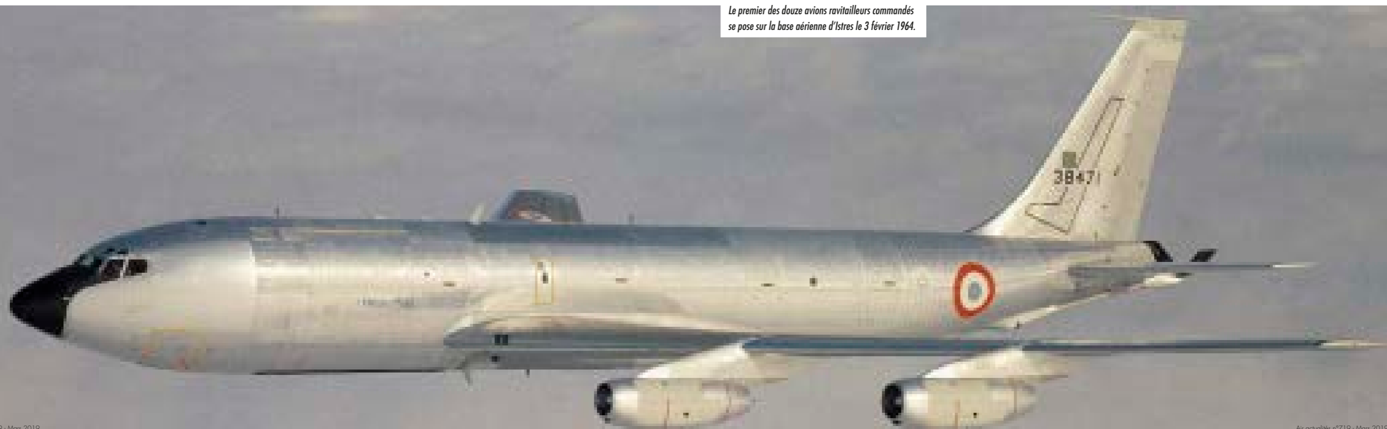
Le premier des douze avions ravitailleurs commandés se pose sur la base aérienne d'Istres le 3 février 1964.