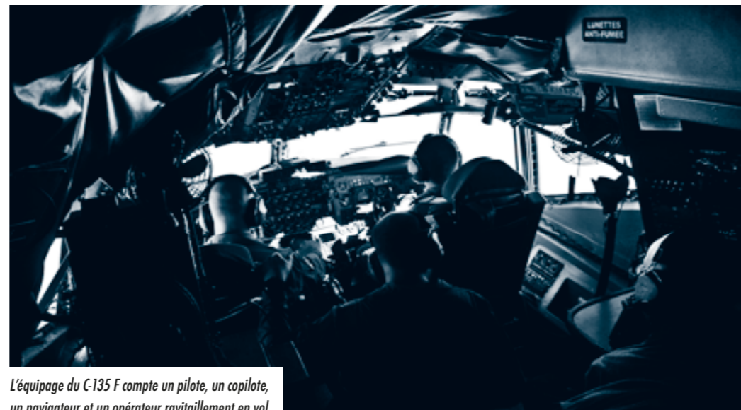
L'équipage du C-135 F compte un pilote, un copilote, un navigateur et un opérateur ravitaillement en vol.