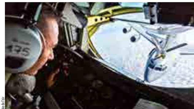
L'opérateur de ravitaillement dirige la perche rigide du C-135 à l'aide de manettes de commande.

Les PLD sont composées de deux rangées de lampes. La rangée de gauche est utilisée