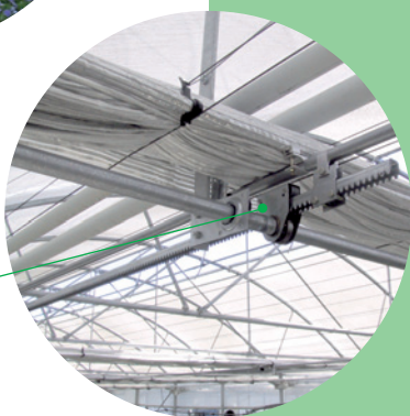
Entraînement par crémaillère