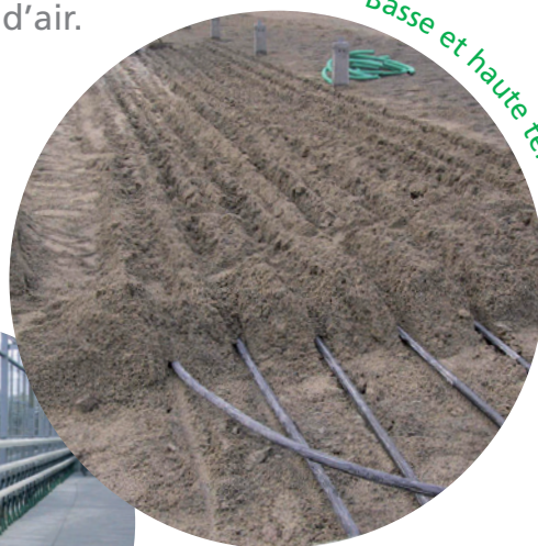
Basse et haute température