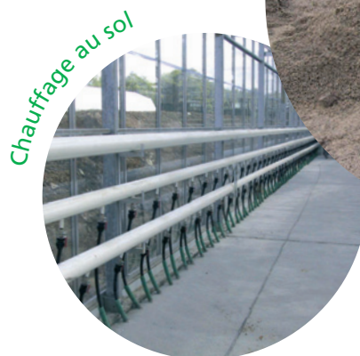
Chauffage au sol