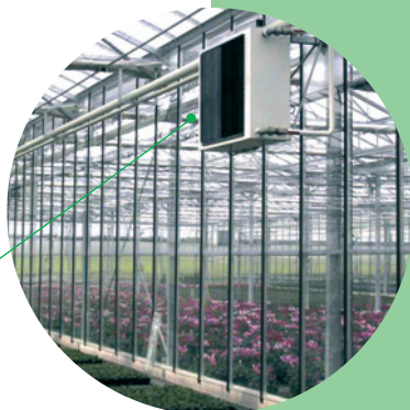
Aérothermes, eau chaude