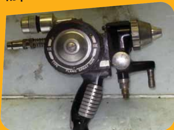
Albéric DUFOUR-VIET ©

La pulvérisation thermique de métal en fusion (zinc et alliage zinc aluminium) quel que soit le procédé (arc électrique ou combustion de gaz) vous expose à de nombreux risques dont l'inhalation de gaz et de poussières métalliques.