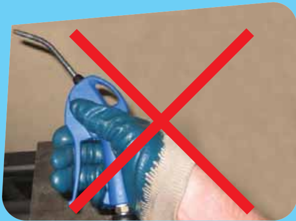
Albéric DUFOUR-VIET ©

L'usage répandu du soufflage par air comprimé est dangereux à de nombreux titres, il doit être combattu. Souffler des poussières les remet en suspension dans l'atmosphère de travail ou leur fait prendre une vitesse dangereuse pouvant causer des blessures.