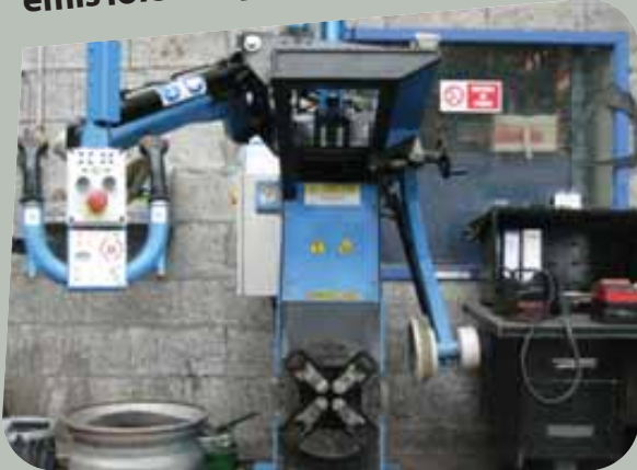
Albéric DUFOUR-VIET ©

Exposition aux produits contenus dans le pneu et la jante (noir de carbone/silice/plomb, poussières de frein) aux produits utilisés (ciment, liquide étanchéité...) et aux produits émis lors des phases de fraisage, de recreusage ou de marquage (fumées et poussières).