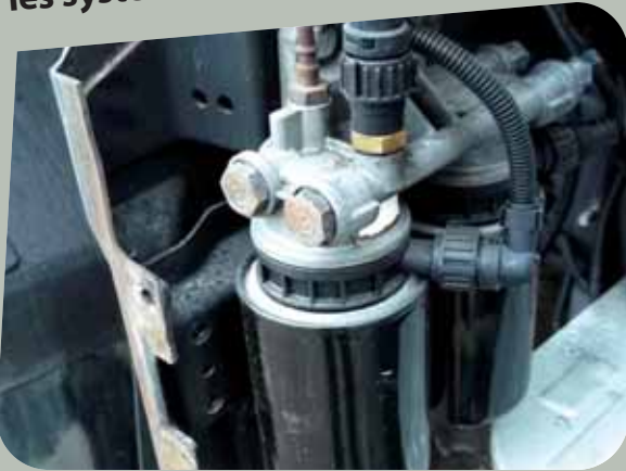
Albéric DUFOUR-VIET ©