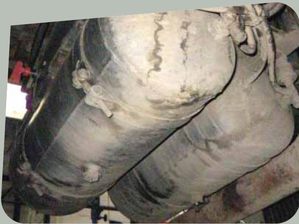
Albéric DUFOUR-VIET ©