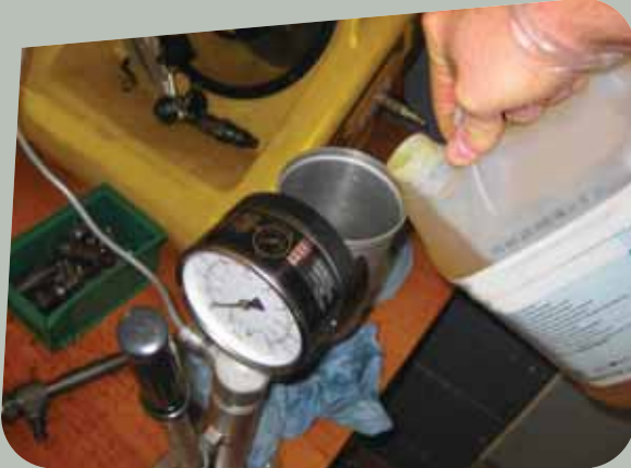
Albéric DUFOUR-VIET ©

Exposition au risque chimique : travaux sur rampes, injecteur et bancs de tests injecteurs / prise de compression... Exposition au gazole et au fluide d'essai diesel. Attention : le gazole est suspecté d'être cancérigène ! Dans ces phases de travail, il se retrouve sous forme liquide ou pulvérisée.