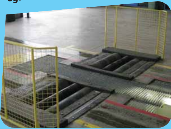
Albéric DUFOUR-VIET ©

Les freinomètres peuvent être disposés en fosse ou à l'avant d'une fosse, ce qui ajoute également les risques liés à l'utilisation d'une fosse de visite lors des opérations de test.