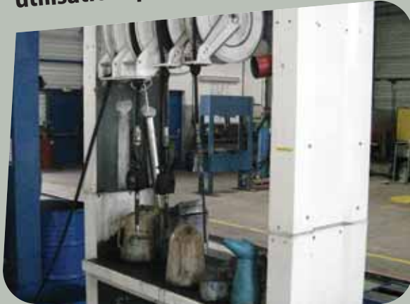
Albéric DUFOUR-VIET ©

Les huiles neuves (moteur, boîte, pont/différentiel/roulement/ralentisseur/réducteur) peuvent contenir des additifs cancérigènes. Prenez les mêmes précautions lors de leur utilisation qu'en manipulant les huiles usagées.