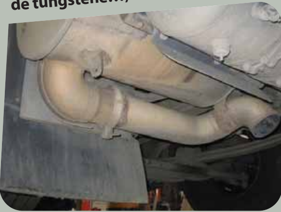
Albéric DUFOUR-VIET ©

Les suies et poussières présentes sur et à l'intérieur de ces organes sont cancérigènes (ex : HAP). Les matériaux à l'intérieur des catalyseurs et des FAP peuvent être toxiques et cancérogènes, il est nécessaire de se préserver des poussières pouvant être libérées lors de leur ouverture (FCR, carbure de silicium, oxyde de vanadium, cordiérite, oxyde de tungstène...).