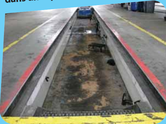
Albéric DUFOUR-VIET ©

Les travaux sur fosse ou à proximité vous exposent à de nombreux risques : chute de hauteur, de plain-pied ou d'objet, écrasement par chute d'organes mécaniques, risque ATEX, risque chimique par accumulation de gaz et de liquides en fond de fosse. Le bruit dans un espace confiné est également plus dangereux (réverbération).