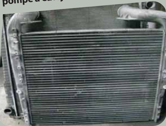
Albéric DUFOUR-VIET ©

Les liquides de refroidissement (LDR) sont dangereux de par leur composition (présence d'éthylène glycol, de produits détergents et antioxydants, traces de métaux lourds). Exposition lors des opérations de manipulation du LDR ou des produits concentrés de recharge, lors des opérations ouvrant le circuit d'eau (vidange, remplacement du liquide ou du filtre à eau, purge du système, opérations de mise sous pression du système) et les opérations de maintenance ou de remplacement d'éléments du circuit (radiateur/durite/pompe à eau/joint de culasse, vase expansion travaux sur réchauffeurs, chauffage...).