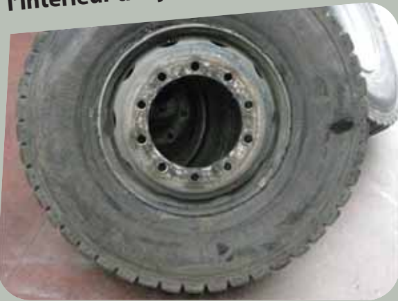
Albéric DUFOR-VIET ©

Exposition aux risques lors des opérations de permutation de roues, de dépose et de re- pose de roue pour accéder à un autre organe, d'ajustement de pression ou d'équilibrage... Les masselottes d'équilibrage peuvent être en plomb. Le pneumatique contient des substances dangereuses sous forme de poussières fines (noir de carbone/silice) l'intérieur des jantes contient des poussières de freins.