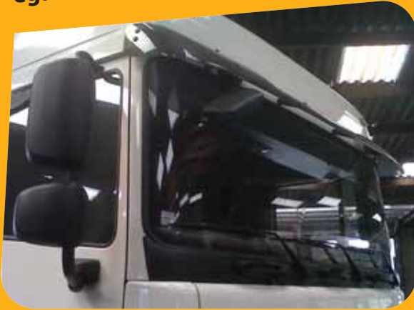
Albéric DUFOUR-VIET ©

Les colles joint de pare-brise et les primaires peuvent contenir des isocyanates (allergisants) ainsi que des solvants pétroliers dangereux. Les résines de réparation peuvent également être dangereuses.