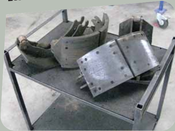
Albéric DUFOUR-VIET ©

Exposition lors des opérations de : rectification des disques et tambours, remplacement, chanfreinage, rivetage, toilage des garnitures de friction. Les poussières de garnitures de frein sont très dangereuses quelle qu'en soit la composition (amiante sur certains modèles anciens ou étrangers, fibres céramiques réfractaires, fibres minérales ou organiques...). Il est nécessaire de se protéger et d'éviter leur inhalation. Les nettoyeurs freins sont également dangereux.