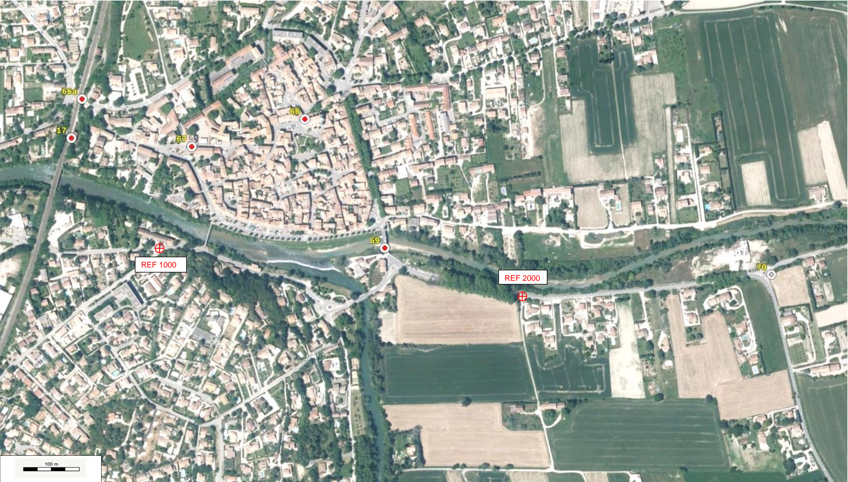
Serveur de fiches géodésiques : les repères de nivellement COMMUNE DE BEDARRIDES