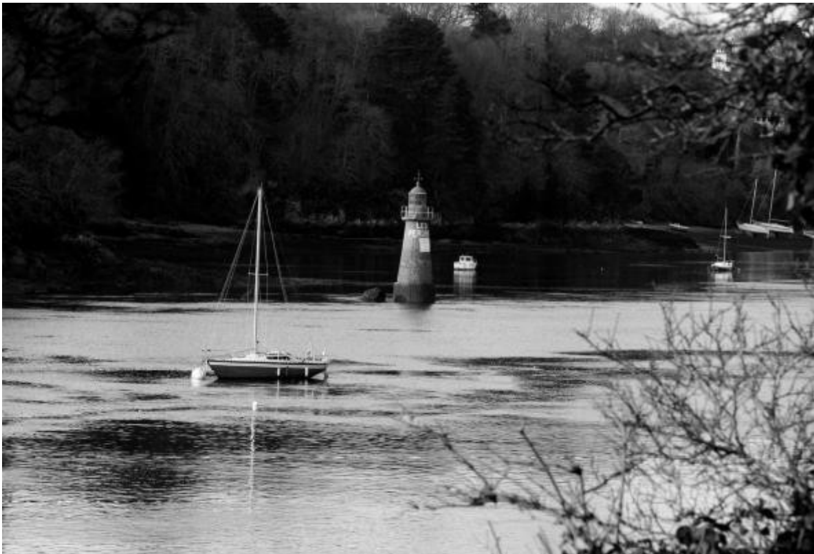
Figure 1: Rivière en Bretagne côté "Ar Mor"

Ces actions s'inscrivent dans une démarche générale « horizon 2030 » qui vise à définir et à améliorer l'urbanisation des communes dans les prochaines années. Le but est d'améliorer l'environnement et la qualité de vie.