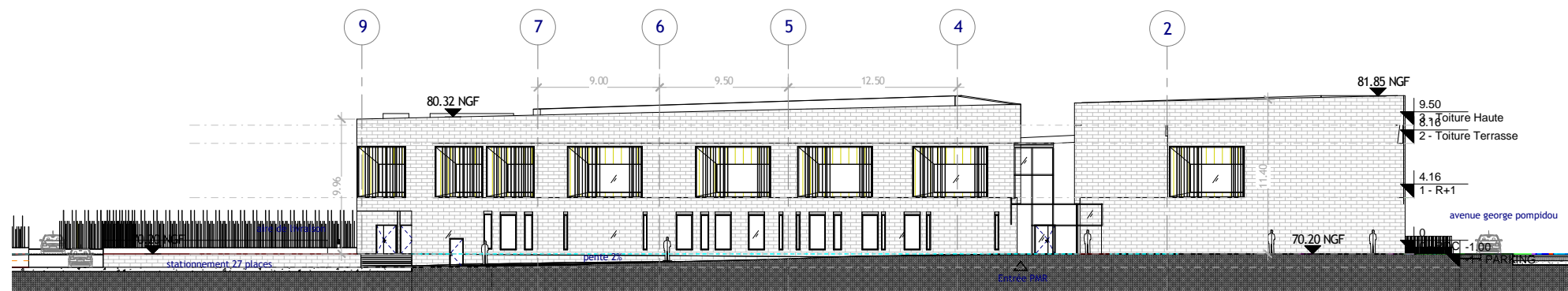
④ Elévation Nord