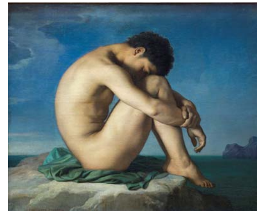
Doc 12 - Hippolyte FLANDRIN, Jeune homme nu assis au bord de la mer , 1856, peinture à l'huile