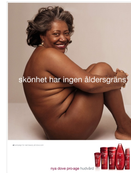
Doc 8 - Annie LEIBOVITZ, Publicité pour les produits d'hygiène Dove, 2007 (traduction : «Trop âgée pour une publicité anti-âge ?»)