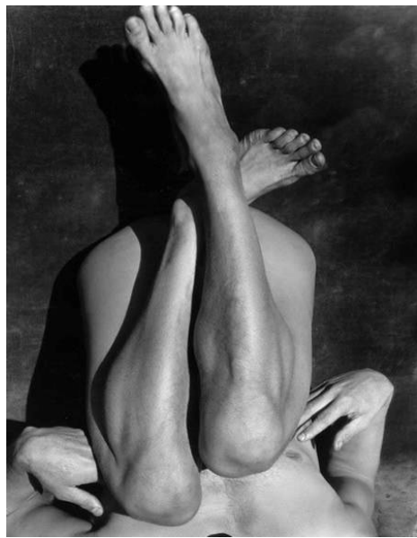
Doc 2 - Imogen CUNNINGHAM, John Bovington 2 , photographie n&b argentique, 1929