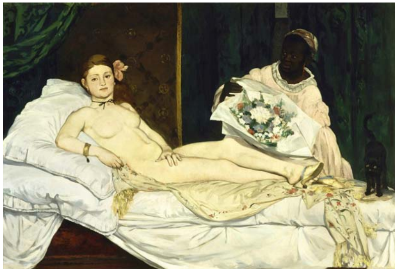
Doc 1 - Edouard MANET, Olympia , huile sur toile, 1863