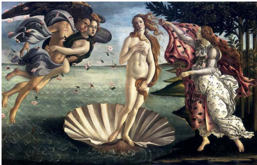
Doc 6 - Sandro BOTTICELLI, La Naissance de Vénus , peinture à la tempera, 1485