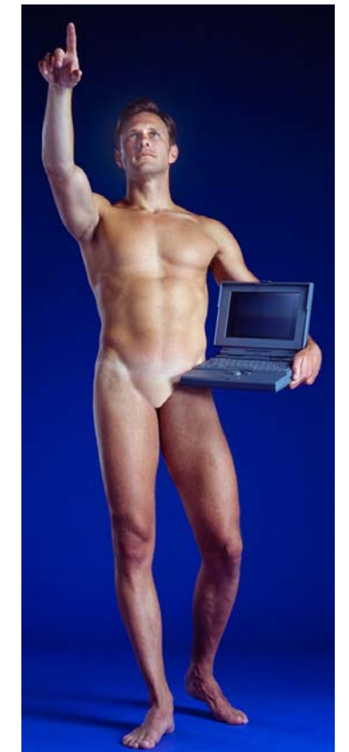
Doc 9 - AZIZ + CUCHER, Man with computer , de la série Faith, Honor and Beauty , tirage chromogène, 1992