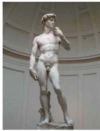
Doc 11 - Michel-Ange, David , 1504, marbre