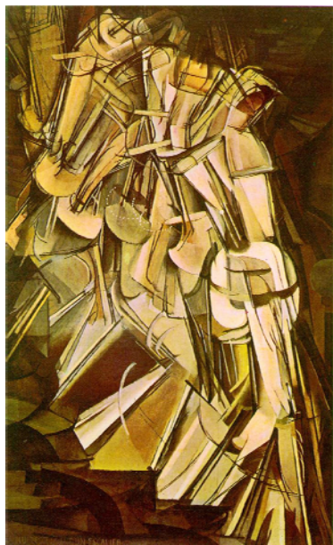
Doc 5 - Marcel DUCHAMP, Nu descendant un escalier n°2 , peinture à l'huile, 1912