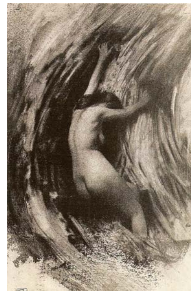
Doc 7 - Robert DEMACHY, La Lutte , tirage à la gomme bichromatée, 1904