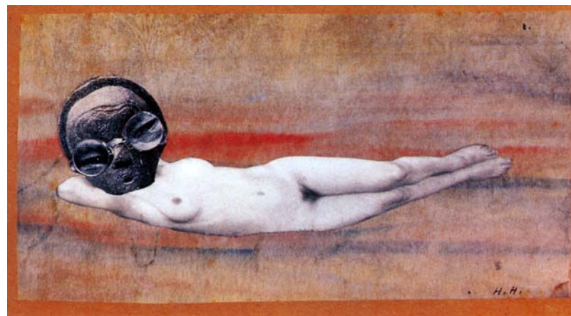
Doc 10 - Hannah HÖCH, A Strange Beauty , photomontage et aquarelle, 1929