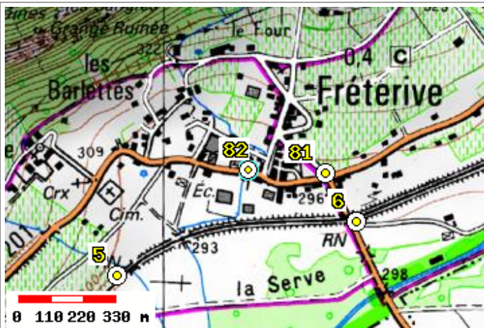
Carte : 3432 ALBERTVILLE