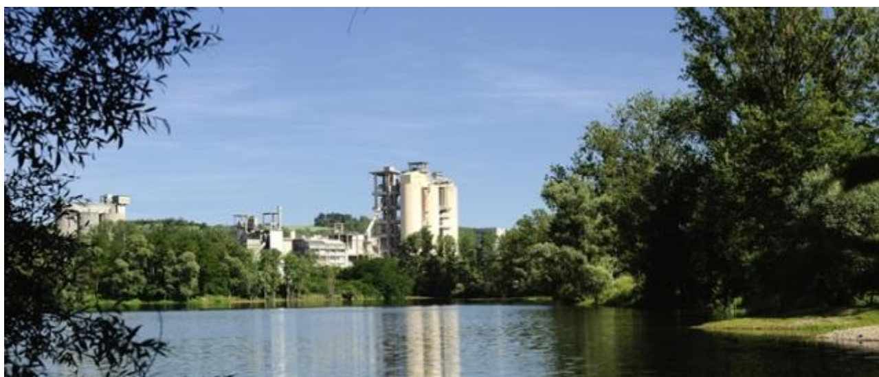
Usine Vicat Créchy

(Nouvelles ressources pédagogiques & numériques + visite de cimenterie)