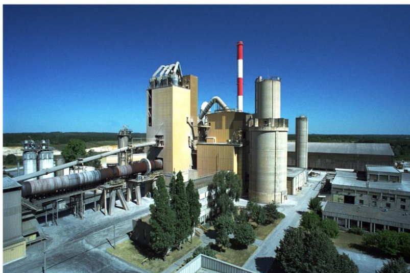
Cimenterie de BUSSAC

(Nouvelles ressources pédagogiques & numériques + visite de cimenterie)